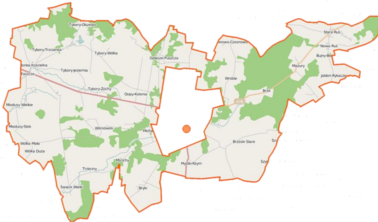
Mapa Gminy Wysokie Mazowieckie

Użytki rolne na terenie gminy Wysokie Mazowieckie stanowią 12 223 ha, lasy i grunty zadrzewione 3 800 ha, grunty zabudowane i zurbanizowane 446 ha, grunty pod wodami 48 ha, nieużytki 90 ha, inne 4 ha. Na jej terenie znajduje się ok. 800 gospodarstw rolnych, w większości nastawionych na produkcję mleczną. Mieszkańcy gminy są zasadniczo potomkami drobnej szlachty podlaskiej, która osiedliła się tu za czasów Księstwa Mazowieckiego. Po większej własności ziemskiej pozostały trzy dwory z XIX w., w: Tyborach-Kamiance, Mazurach i Starej Rusi. W taksonomii grup funkcjonalnych gmin opracowanej przez prof. Przemysława Śleszyńskiego gmina Wysokie Mazowieckie należy do grupy H4_GW: Gminy wiejskie o intensywnej funkcji rolniczej.